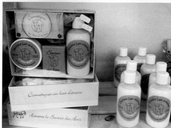
Cosmétiques au lait d'ânesse vendus à St Julien en Champsaur

Une journée Portes Ouvertes était organisée en commun par les 2 structures en début d'été afin de se faire connaître auprès des hébergeurs locaux