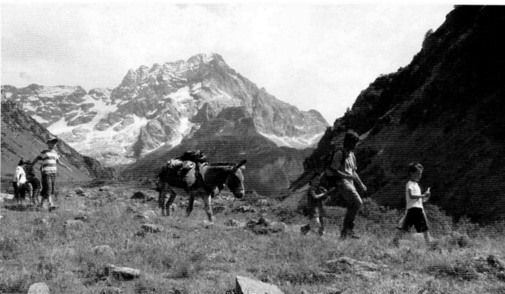
L'âne ne mérite pas sa réputation, il est doux, intelligent et aime la compagnie de l'Homme

Il faut attendre 3 mois après la naissance de l'ânon pour traire une ânesse. Cette opération s'ef-